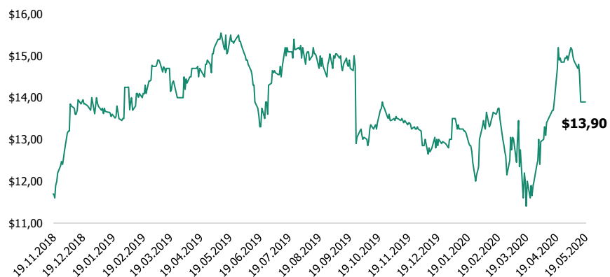
Динамика цен акций в USD